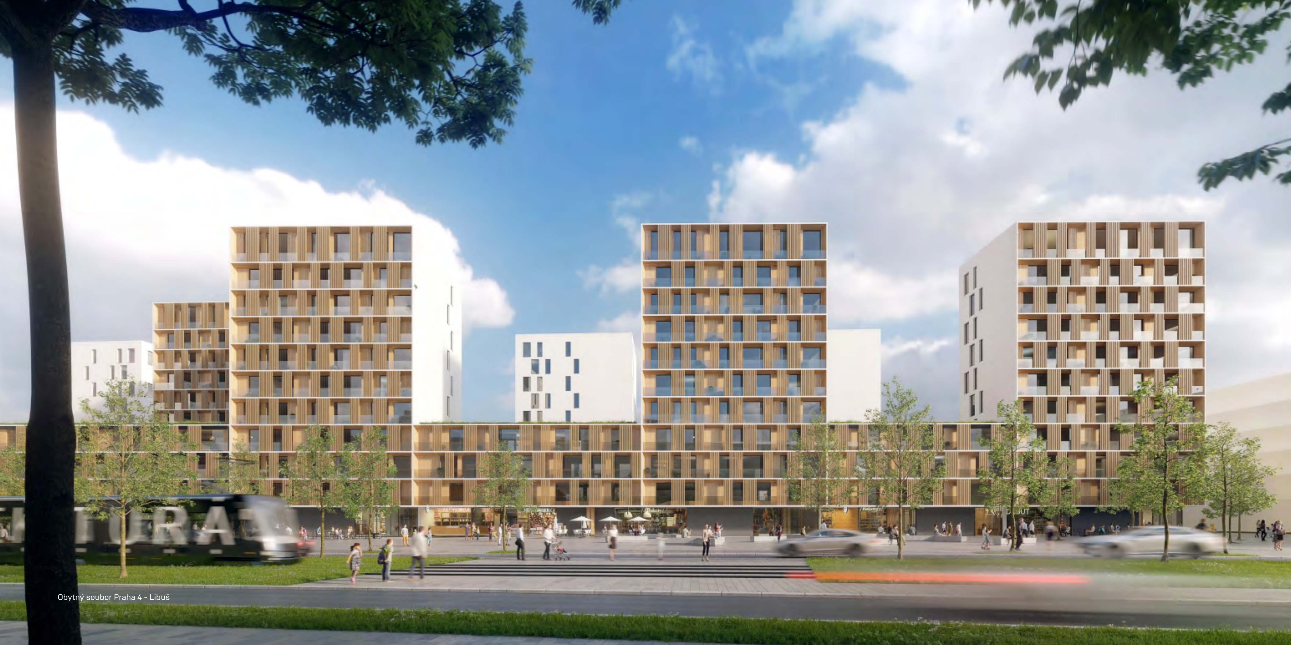
Obytný soubor Praha 4 - Libuš